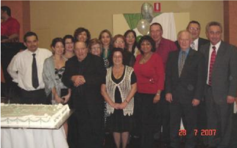
Miembros del Comité de CELAS con representantes del Gobierno y de la Victorian Multicultural Commission

El 28 de julio del 2008 CELAS celebró el trigésimo aniversario de su creación a través de una cena de gala bailable, la que contó con la presencia de más de 350 invitados, entre autoridades, amigos, colegas y personas que reconocen la labor de CELAS en favor de la comunidad hispanohablante de Victoria.